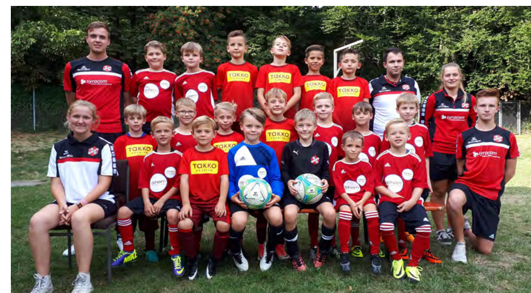
Die Teams der F1 und F2.

Mit der Teilnahme am Turnier unserer Nachbarn in Bleidenstadt, hat die F2 die Hinrunde erfolgreich abgeschlossen. Die Jungs haben super gekämpft und mit viel Spaß und Ehrgeiz tolle Ergebnisse erzielt. Ab jetzt geht es dank finanzieller Unterstützung der Eltern einmal in der Woche in die Soccerhalle in Bleidenstadt. Im Januar bestreiten wir dann einige Hallenturniere bevor die Rückrunde startet.